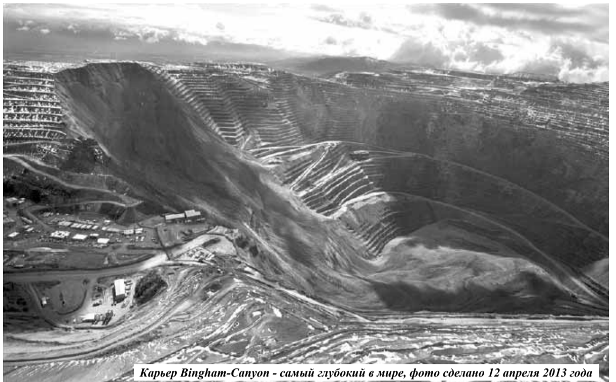
Карьер Bingham-Canyon - самый глубокий в мире, фото сделано 12 апреля 2013 года

Глубина карьера Bingham-Canyon - 1200 метров, а диаметр – более 4 км (данные на 2008 год). Помимо технологических дорог, которые в сумме составляют 800 км, на карьере эксплуатируется ещё