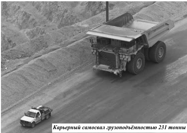
Карьерный самосвал грузоподъёмностью 231 тонны

Более чем столетняя история отработки месторождения «Bingham», а также перспективы его дальнейшей длительной эксплуатации ещё раз ярко демонстрируют огромное значение крупнейших медно-порфировых месторождений, играющих важную роль в мировой минерально-сырьевой базе не только меди, но и золота. Подобные гигантские долгожители горной индустрии, определяющие экономическое и социальное развитие целых регионов и стран, доказывают, какую большую роль играют месторождения руд с низким содержанием полезных компонентов, но с гигантскими их запасами.