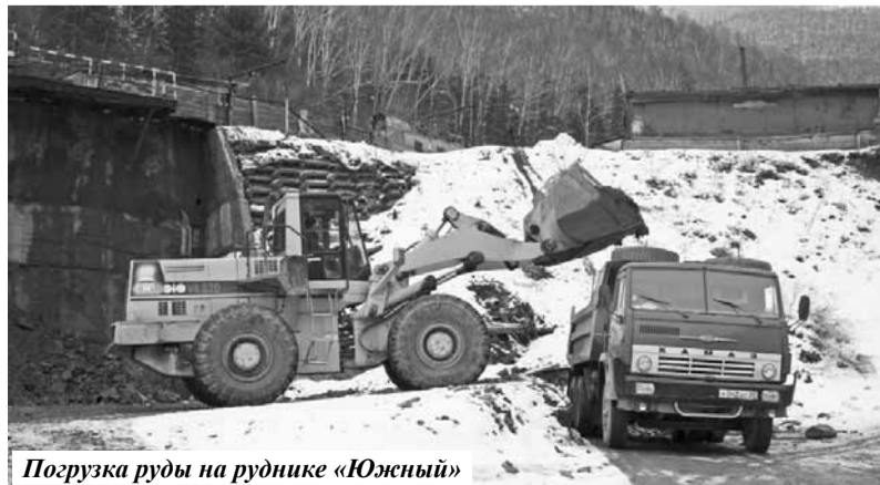
Погрузка руды на руднике «Южный»