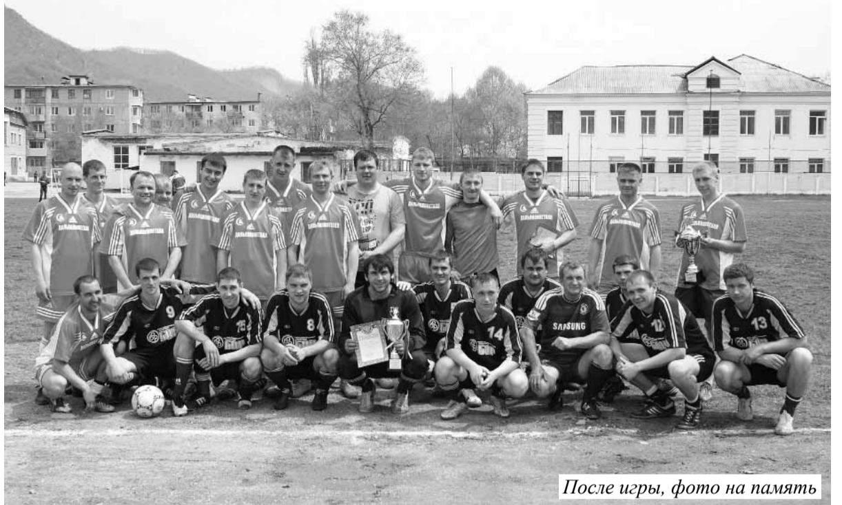
После игры, фото на память

Первый мяч, запущенный бомбардиром «Бора», попал в правый угол наших ворот. Но