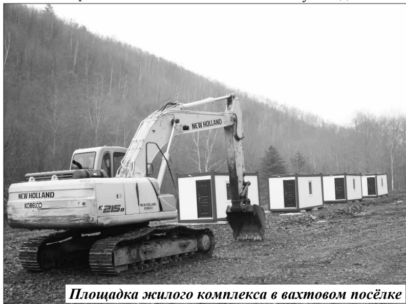
Площадка жилого комплекса в вахтовом посёлке

Также в планах ремонт нижней дороги, по которой добираться до рудника «Силинский» на целых 33 км ближе.