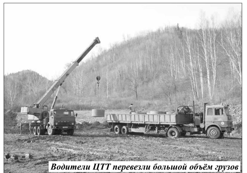
Водители ЦТТ перевезли большой объём грузов

Сегодня горняки «Силинки» трудятся на руднике пять дней в неделю. Каждый будний день они приезжают на