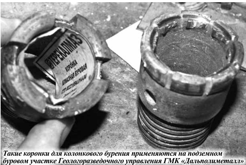
Такие коронки для колонкового бурения применяются на подземном буровом участке Геологоразведочного управления ГМК «Дальполиметалл»