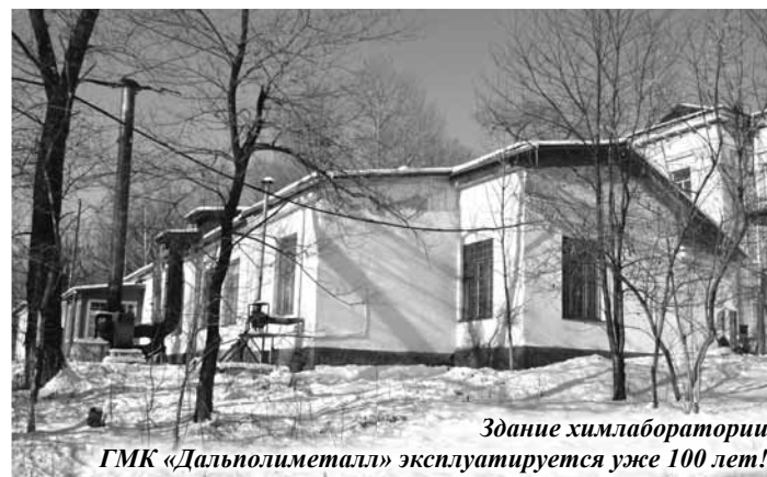
Здание химлаборатории ГМК «Дальполиметалл» эксплуатируется уже 100 лет!

Поздравляю ваш дружный коллектив с круглой датой – со столетием лаборатории химического анализа ОАО «ГМК «Дальполиметалл»!