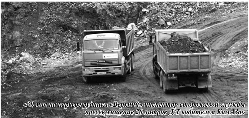
«30 мая на карьере рудника «Верхний» инспектор сторожевой службы пресёк хищение 20 литров ДТ водителем КамАЗа»

В ГК «Дальполиметалл» регулярно раскрываются факты воровства на производстве и пренебрежения трудовой дисциплиной. Например, в мае сотрудники сторожевой службы задержали 92 нарушителя пропускного режима. При этом в ЦРММ (со сменой там руководства) количество нарушений пропускного режима резко снизилось.