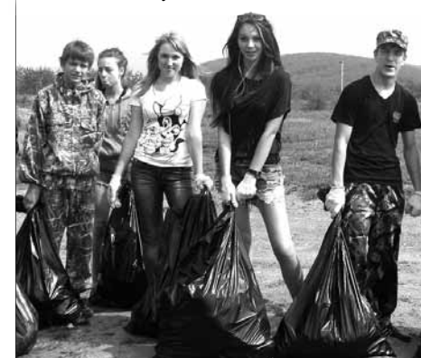
Школьники на Международном экологическом субботнике, лидовский пляж

Глава ДГО Игорь Сахута поблагодарил всех, кто принял участие в экологическом субботнике и выразил надежду на то, что в будущем дальнегорцы будут активнее наводить порядок на территории округа. Игорь Сахута также заметил, что чисто там, где не мусорят.