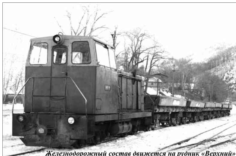
Железнодорожный состав движется на рудник «Верхний»

Что касается плана модернизации подвижного состава железнодорожного цеха, то он включает в себя не только приобретение отдельных частей думпкаров, но и покупку новых «УВС-22». Так, по специальному заказу ГК «Дальполиметалл», в Удмуртии, в цехах старейшего в России «Камбарского машиностроительного завода» изготов-