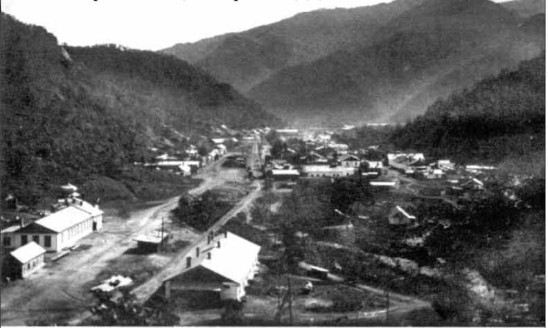
Тетюхе во времена концессии, район ЖДЦ

Продолжение читайте в следующем выпуске газеты.