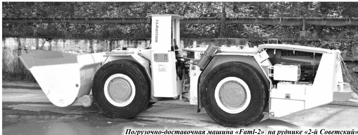
Погрузочно-доставочная машина «Faml-2» на руднике «2-й Советский»

На рудниках ГК «Дальполиметалл» встречаются погрузочно-доставочные машины самых разных модификаций, выпущенные