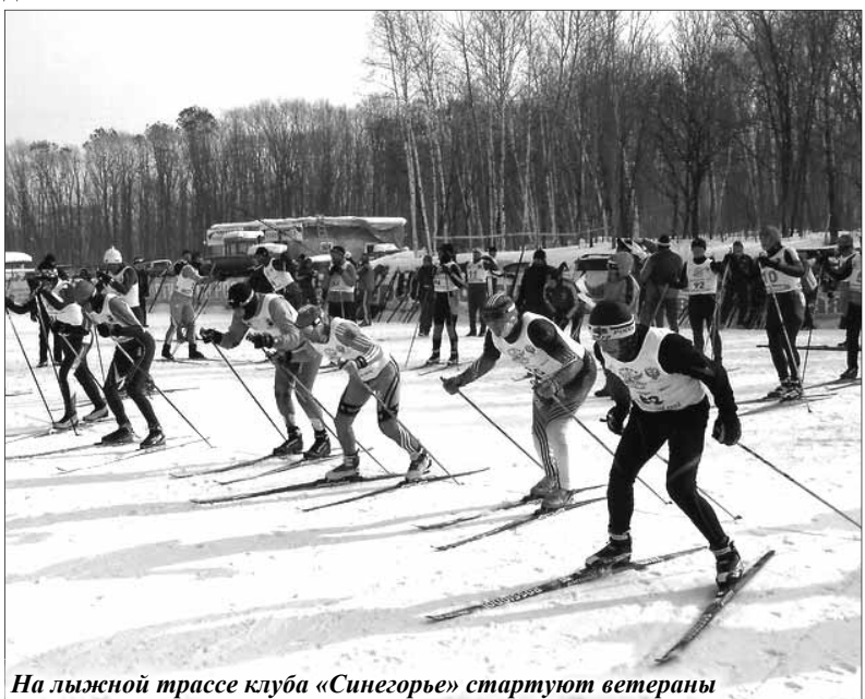
На лыжной трассе клуба «Синегорье» стартуют ветераны

С 23 по 25 января в Арсеньеве на лыжной трассе клуба «Синегорье» состоялись зональные соревнования по лыжным гонкам среди спортсменов-любителей среднего и старшего возраста. Первенство Дальневосточного Федерального округа проводилось в честь 25-летия РЛС.